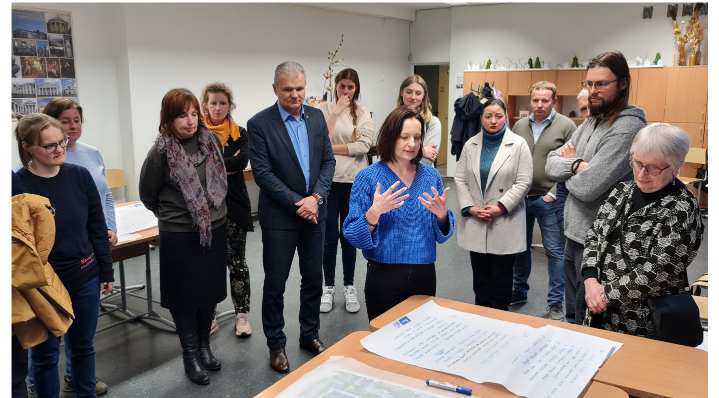
Pirmojo susitikimo su gyventojais dėl „Vėtrungės“ aikštės ir pėsčiųjų alėjos akimirka, 2024-04-03 Vilnius.