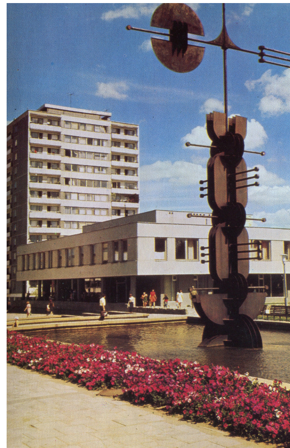
Minėta „Vėtrungės“ nuotrauka, šaltinis . Autorystė nenustatyta.