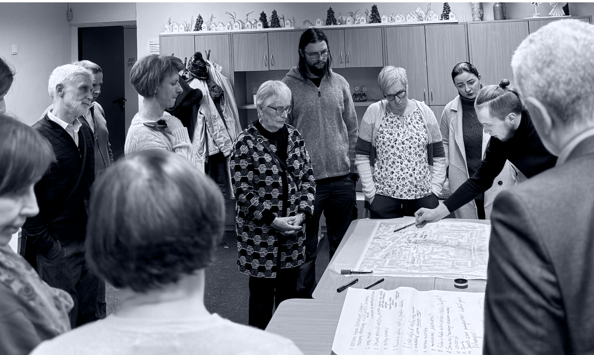
Pirmojo susitikimo su gyventojais dėl „Vėtrungės“ aikštės ir pėsčiųjų alėjos akimirka, 2024-04-03 Vilnius.