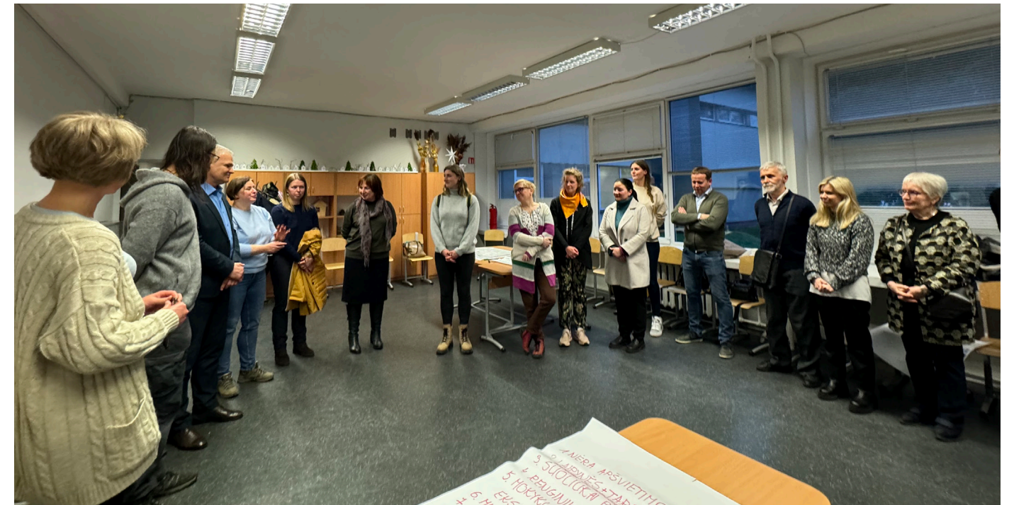
Pirmojo susitikimo su gyventojais dėl „Vėtrungės“ aikštės ir pėsčiųjų alėjos akimirka, 2024-04-03 Vilnius.

Šiame leidinyje pristatomi apibendrinti pirmojo susitikimo rezultatai ir raštu pateikti pasiūlymai.