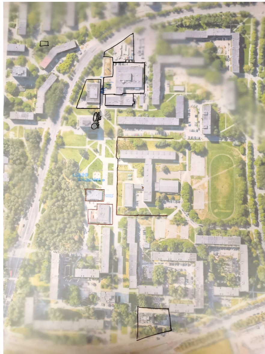
Susitikimo metu kurtas kliūčių žemėlapis.